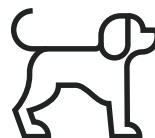
HÖCHSTGEWICHT 15 KG